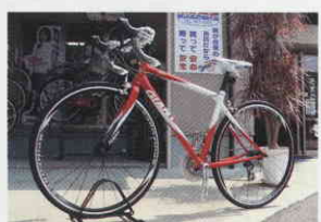
若者に人気のロードタイプ本格的にやりたい方はまずはこれから入門してみてください

てみました。以前は「マウンテンバイク」が人気だったのですが、今では「ロードタイプ」の自転車を購入する若者が増えているそうです。ただ、こちらは少し値段が張るので、「クロス」と呼ばれるタイプが値段も手ごろで売れ筋商品だとのこと。こちらは3万円くらいから手に入ります。「ガソリン燃やさずに脂肪を燃やそう!」(店主談)ですね。 仕事をバリバリやるには健康管理が一番! 自転車に限らず、運動を心がけて、元気に企業活動しましょう。