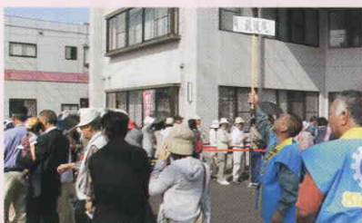
販売前にはこの行列!!

取扱店の皆様、換金期限は12月25日となっていますのでお忘れなようお願いします。