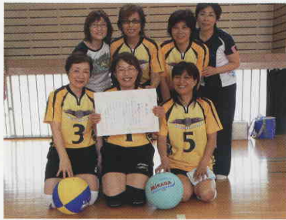
惜しくも準優勝。ですが、がんばりました。ハイ、笑顔!!

最後に、只今女性部では部員募集中です。一緒に新宮町を盛り上げていきたい、稼業を成長させたい、とお考えの方々、是非お待ちしております。