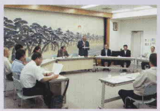
活発な討議がとびかいました

企業側と議員の方々の熱心な答弁に、今後の新宮町の発展と振興への想いがヒシヒシと伝わってきました。これからお互いが連携協力していければ幸いです。