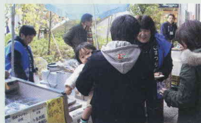
多くの来客に新宮町をPR

こうしたイベントを通じて新宮町が元気になるように商工会もどんどんPRしていきたいと思えます。