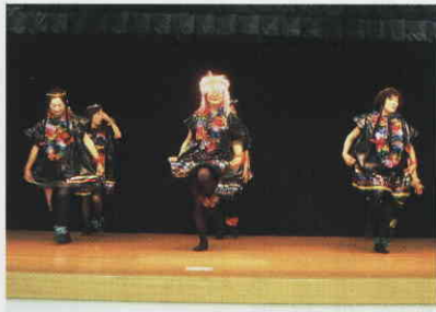
新しい芸も披露！毎年お疲れ様です。

平成21年度、第40回通常総会が皆様の協力により無事終了することができ心より御礼申しあげます。 役員改選に伴い、2期目、女性部長を引き受けることとなりました。