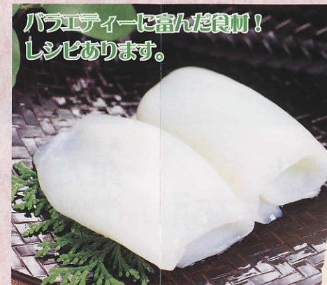
バラエティー豊富で食前! レシピあります。