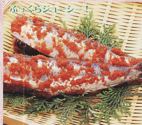
ぶっくらジューシー!