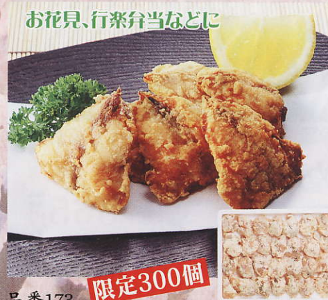
お花見、行楽弁当などに